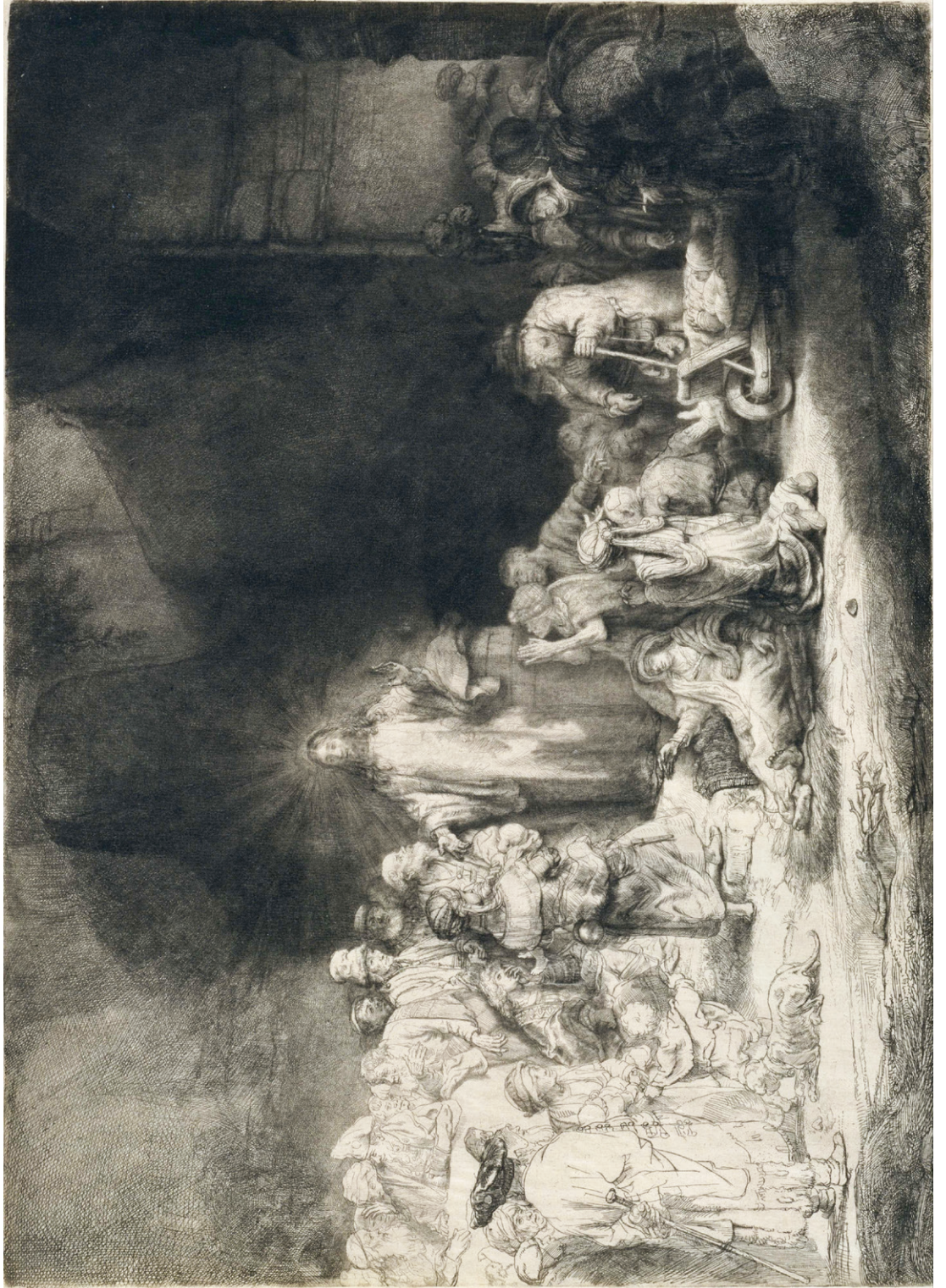
Rembrandt, Wikimedia Commons