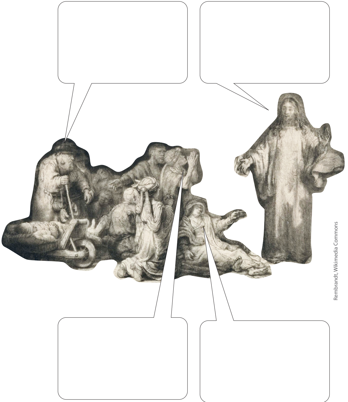
Rembrandt, Wikimedia Commons